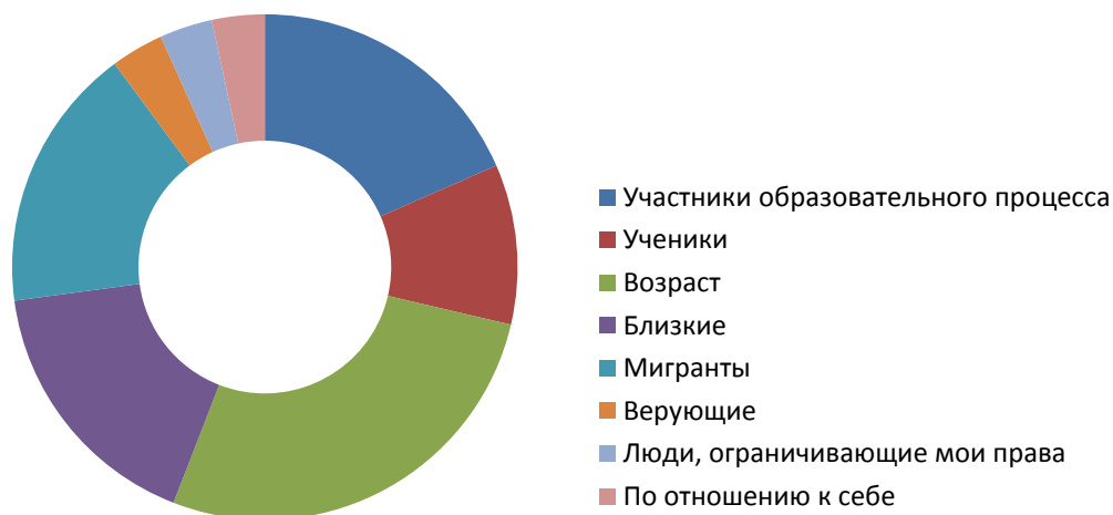
Рисунок 1. Субъекты проявления толерантного отношения у педагогов

Ответы, полученные на этот вопрос, с помощью процедуры контент-анализа были классифицированы и проранжированы (рисунок 1).