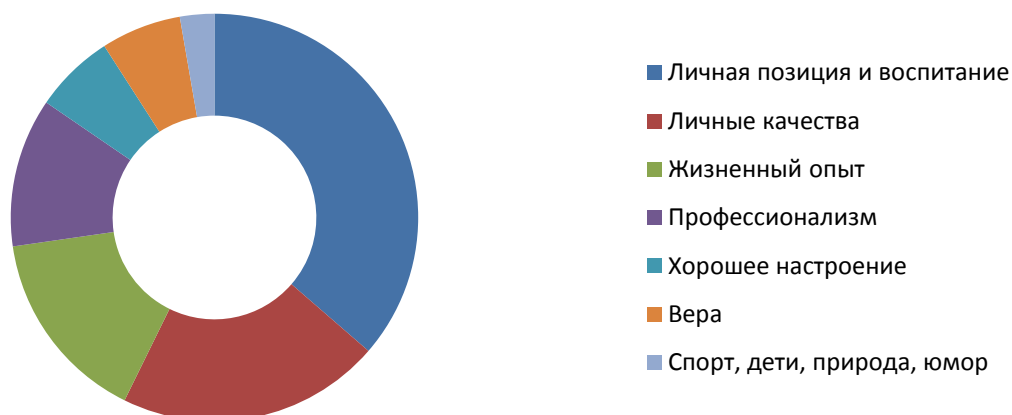
Рисунок 3. Факторы, способствующие проявлению толерантности у педагогов

Наглядно полученные данные представлены на рисунке 3.